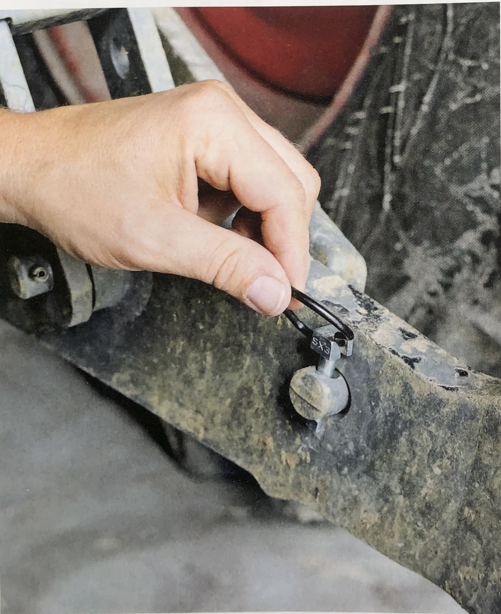
Sicherheitssplinte sind besonders am Unterlenker von Vorteil, da sie sich nicht unbeabsichtigt öffnen.

Klappsplinte sind nur so lange sicher, so lange der Bügel geschlossen ist. In manchen Situationen können sie sich aus Versehen öffnen . Nicht so bei diesen Splinten, die einen Trick nutzen.